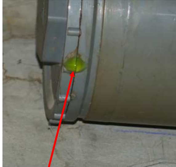
Fuite au joint